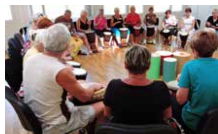
Bubnování jako forma muzikoterapie. Mimo taneční workshopy si účastníci Tanečního campu seniorů také mohli vyzkoušet bubnování v kruhu.