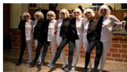
K vidění bylo nevidané. Během krátkých vystoupení senioři ukázali sobě navzájem i veřejnosti, čemu se věnují.