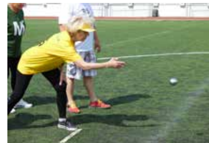
Deset disciplín. Mezi jinými běh, střelba, hokej, tenis, pétanque, basketbal a další.

Od roku 2016 organizuje TOTEM, z.s. pro Krajskou radu seniorů Sportovní hry seniorů Plzeňského kraje. Setkání aktivních seniorů, uspořádané s cílem společně ukázat široké veřejnosti seniorský potenciál, sdílet radost z pohybu a vzájemně se inspirovat, proběhlo v TOTEMU už potřetí. Na startu se sešlo 50 seniorů, 10 seniorských rozhodčích a mnoho studentů Základní a střední školy církevní v Plzni a Vyšší odborné školy zdravotnické, managementu a veřejnosprávních studií a spousta fandících hostů.