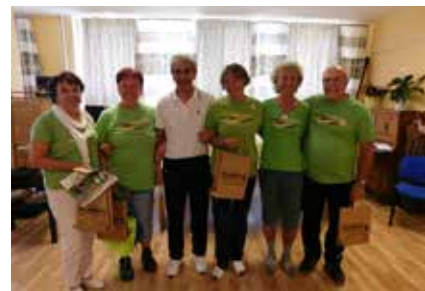
Úspěšný TOTEMový tým. Jsme velmi pyšní na to, že naši senioři získali krásné druhé místo v soutěži týmů.