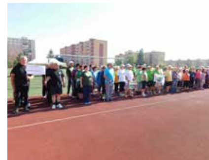
Slavnostní zahájení. Na hřišti 1. ZŠ se sešlo 10 družstev z celého kraje, všichni připraveni zvítězit.