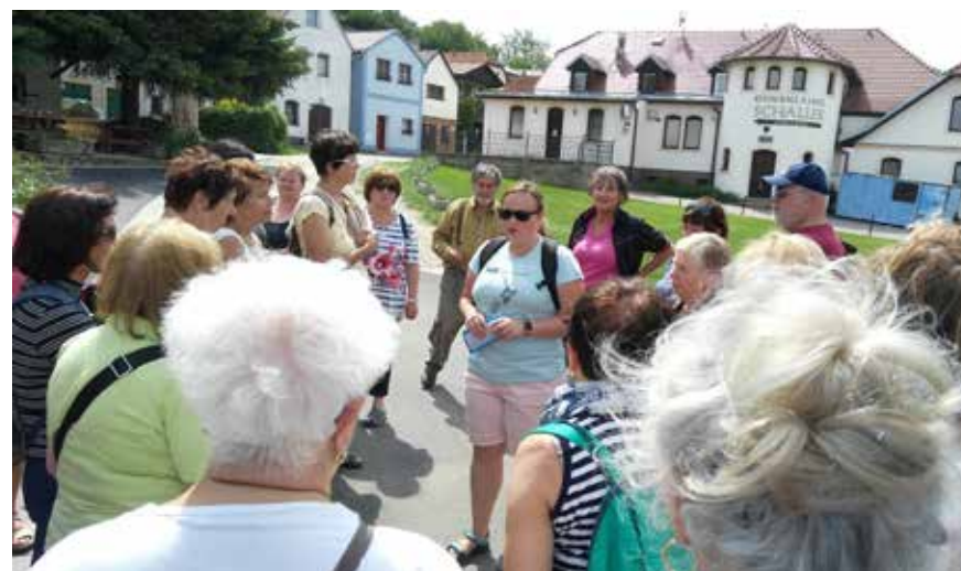
Putování po jižní Moravě s výletem do Vídně. V pěti dnech jsme navštívili spoustu krásných míst, počínaje Třeboní při cestě na Moravu, krásnou vesničku Šatov, kde jsme bydleli, městečko Retz s větrným mlýnem, Nový Šaldorf s typickými modrými sklepy, zámek ve Vranově nad Dyjí, Vídeňské centrum a památky se zastavením na zámku Schönbrunn s úžasnými zahradami a v neposlední řadě město Znojmo se svými dominantami. A další a další...

Polnosti s vinnou révou, řeka Dyje, krajina lemovaná nevelkými kopci, malá městečka s roztomilými vinnými sklípky, fyzické výkony, zážitky degustační i kulturní. To vše mohlo zažít 45 účastníků tradičního týdenního TOTEMového zájezdu.