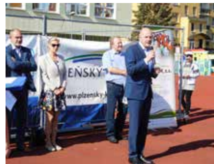
Slavnostní zahájení. Všechny sportovce přišli pozdravit představitelé Plzeňského kraje, města Plzeň i MO Plzeň 1.