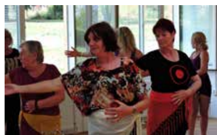
20 tanečních workshopů. Každý senior si mohl vyzkoušet různé taneční styly od country, přes swing, latino-americké či břišní tance pod vedením profesionálních lektorů.