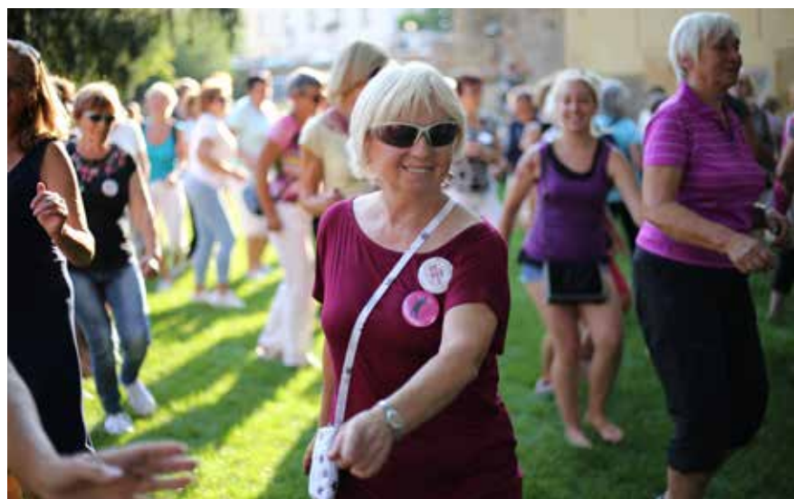
Flashmob v Mlýnské strouze. Jedním z výstupů pětidenního tanečního soustředění byl spontánní tanec v rámci divadelní scény v Mlýnské strouze v Plzni.

Podle zpětné vazby prostřednictvím závěrečného zhodnocení s účastníky, děkovných emailů i zájmu ze strany médií si všichni účastníci pět dní mimo své domovy a každodenní povinnosti užili a to velmi aktivní a netradiční formou.