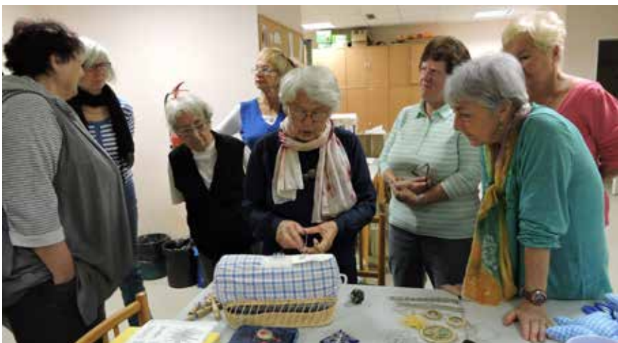
Paličkování. Ukázkou paličkování v rámci pravidelné aktivity - Rukodělné práce - si tentokrát přinesla jedna z klientek TOTEMu. Ženy z kurzu si rády zkouší nové věci.

O klienty individuálně pečuje tým profesionálních pracovníků, u každého mapuje jeho problém a očekávání při vstupu do služby a pravidelně hodnotí, zda jich bylo dosaženo a pokud ne, jak toho docílit. Dokáže poskytnout základní sociální poradenství, doprovázet při složitých životních situacích a spolupracuje s dalšími organizacemi v místě.