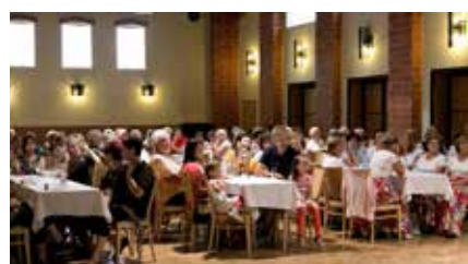
Společenský večer. V rámci večera v Bolevecké sokolovně se prezentovali jak skupiny, tak lektoři Tanečního campu.